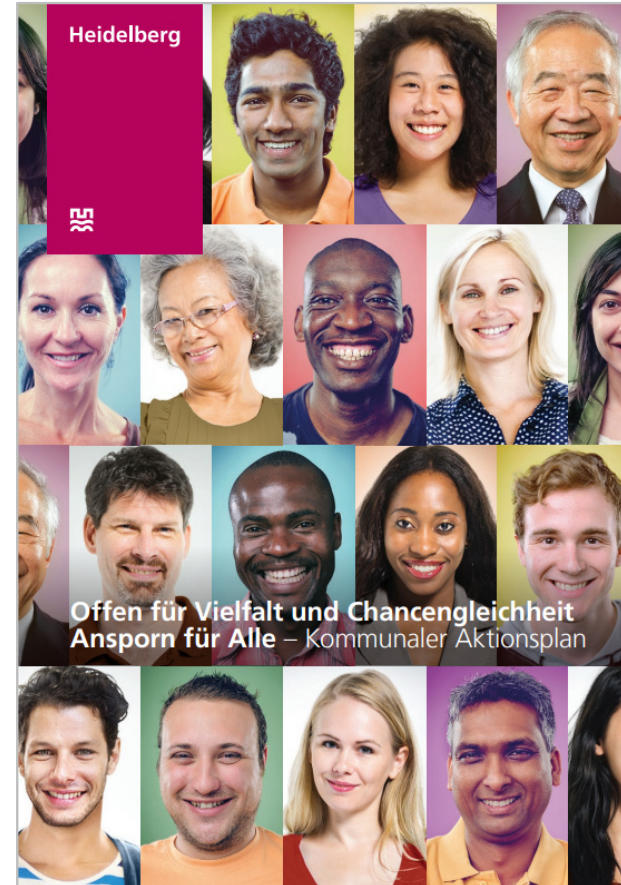
Aktionsplan Stadt Heidelberg