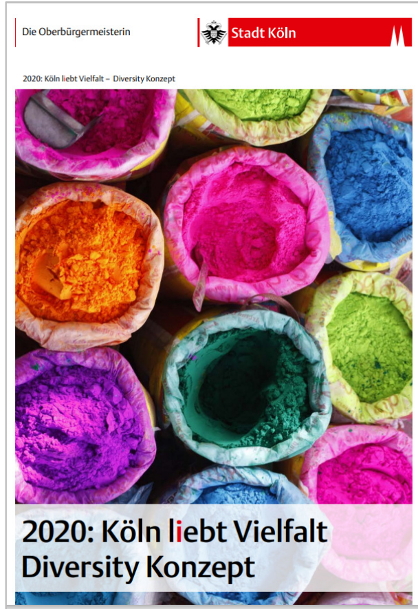
Köln liebt Vielfalt Das Diversity-Konzept der Stadt Köln