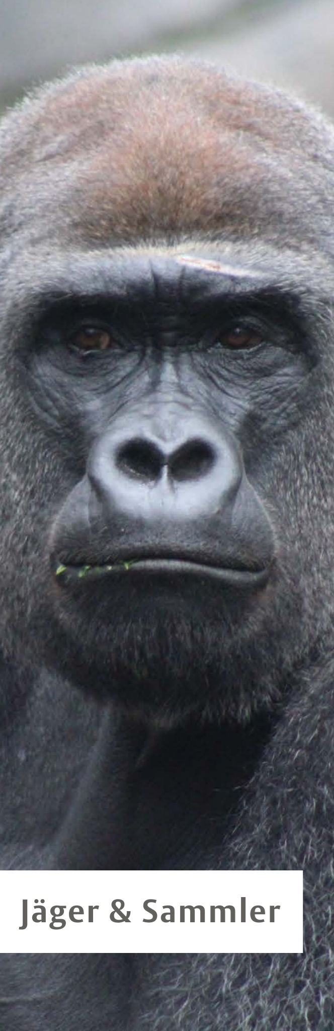
Jäger & Sammler