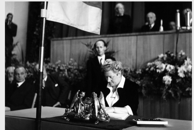
Elisabeth Selbert bei der Unterzeichnung des Grundgesetzes am 23. Mai 1949 in Bonn.