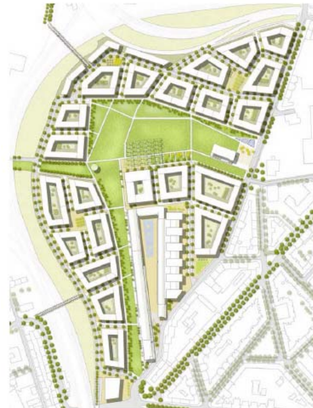
Neue Mitte Altona Autofreies Wohnen - eine Standortbestimmung